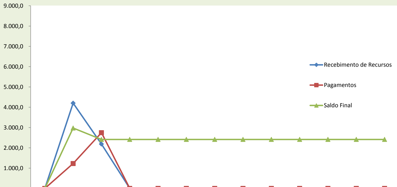
Gráfico 3 - Liberação de Recursos Financeiros em 2023